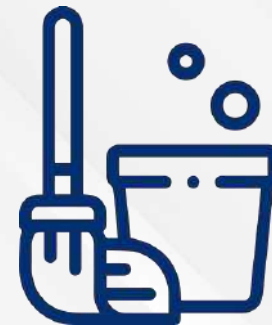
Facilities Services (Hard y Soft)